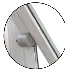
Bisagras con eje de giro horizontal con retención a 25°

CE EN 14351-1 LGAI Technological Center, S.A (APPLUS) Organismo notificado nº0370